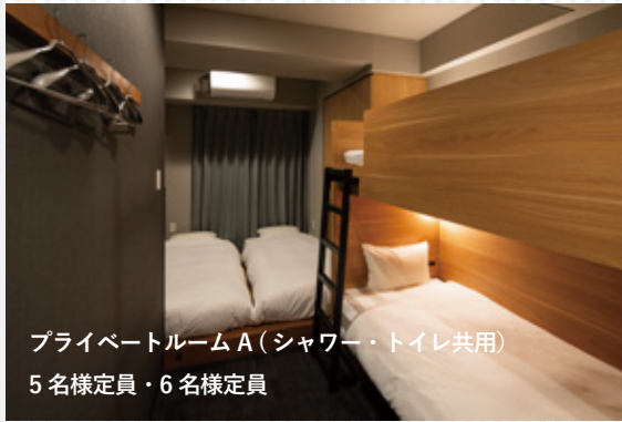
プライベートルーム A (シャワー・トイレ共用) 5名様定員・6名様定員