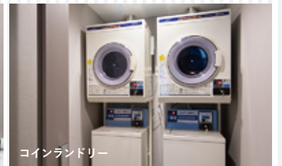
コインランドリー