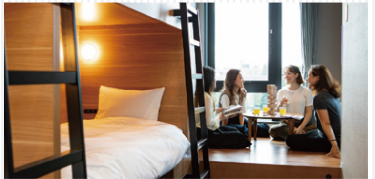
【女性専用】ドミトリー (5名様定員・6名様定員) ベッド5台 (6台) のうち1台利用