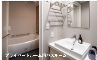
プライベートルーム用バスルーム