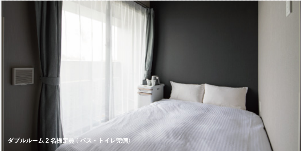
ダブルルーム 2名様定員 (バス・トイレ完備)