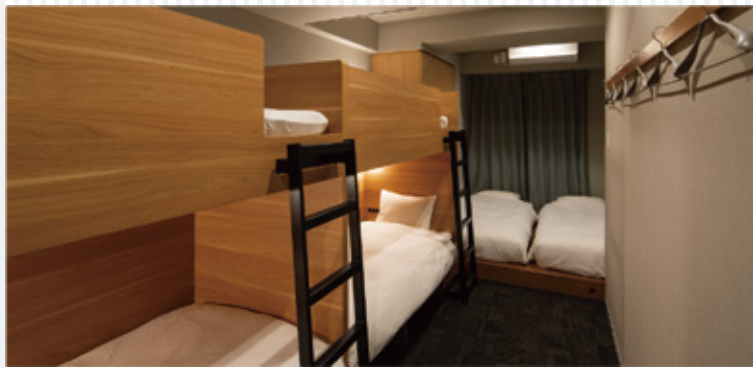
【男女共用】ドミトリー (5名様定員・6名様定員) ベッド5台 (6台) のうち1台利用