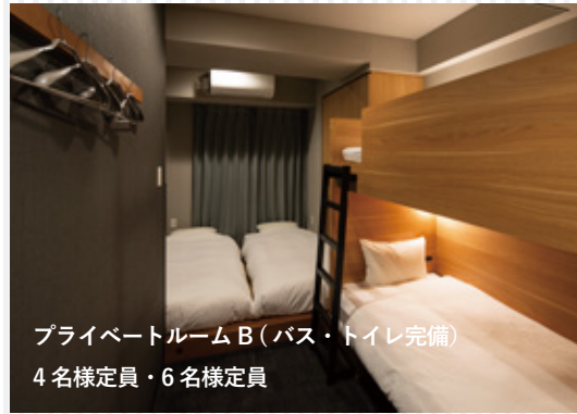
プライベートルーム B (バス・トイレ完備) 4名様定員・6名様定員